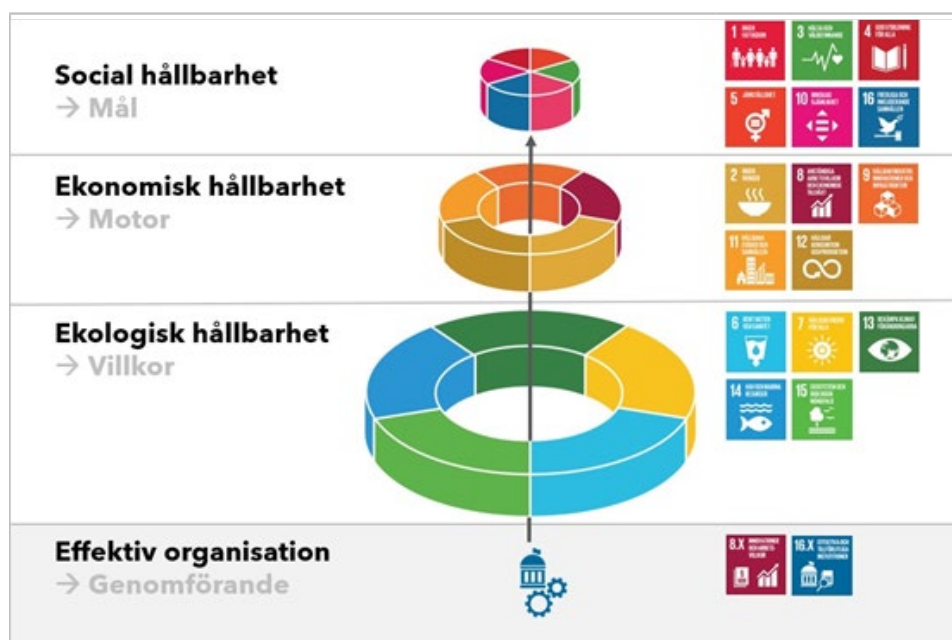
Figur 2: Nyköpings hållbarhetsarbete kan åskådliggöras genom den så kallade "måltårten". Den visar dels hur de globala målen fördelas mellan dimensionerna och vilken övergripande logisk funktion de har.

Agenda 2030 inbegriper 17 globala mål och 169 delmål som syftar till att skapa anständiga och hållbara levnadsförhållanden och levnadsvillkor för alla världens människor.