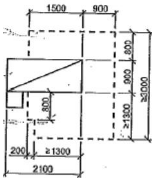
Exempel på sängens placering.

Hygienutrymmet bör placeras i direkt anslutning till sovrummet så att förflyttning till och från säng kan ske med mobil personlyft.