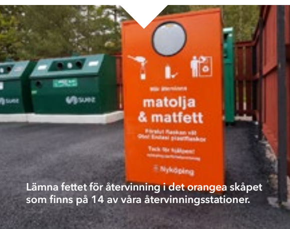
Lämna fett för återvinning i det orangea skåpet som finns på 14 av våra återvinningsstationer.

→ Hämta en miljötratt på Tekniska divisionen (Tillverkarvägen 2) eller i Stadshuset.