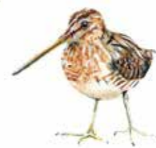
På Labro Ängar häckar ca fem par enkelbeckasin per år.