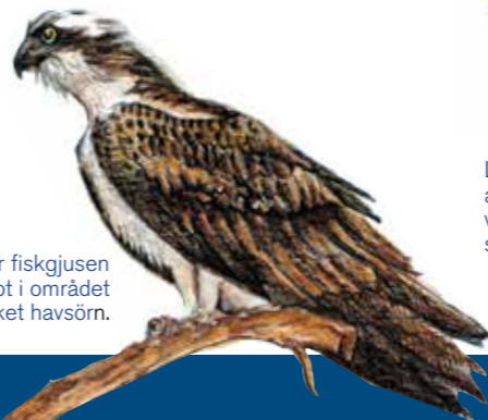
Troligtvis har fiskgjusen minskat något i området p.g.a. så mycket havsörn.

På senhöstarna och under vintern uppträder stora ansamlingar av vigg. Bergand, storskrake samt salskrake ses även i viken. Rovfåglar som havsörn, fiskgjuse och brun kärrhök flyger ofta över reservatet.