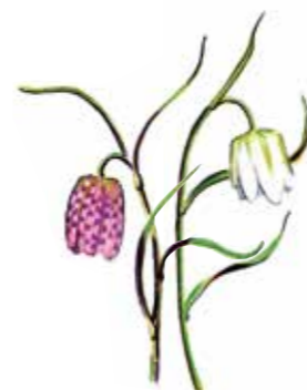
En vacker dag i maj får du kanske se hundratals kungsängsliljor på ängarna.