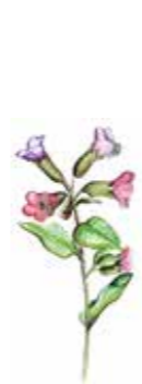
Lungörten gynnas av att hagmarker växer igen till skogslundar.

På öppen mark kan man se kungsängslilja, en art som planterades in här för några decennier sedan.