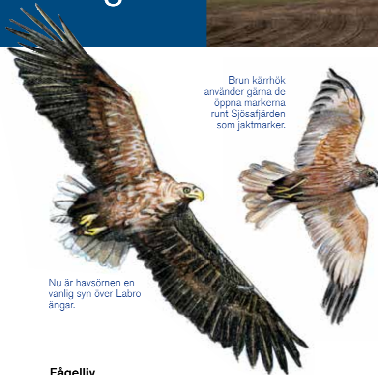
Brun kärrhök använder gärna de öppna markerna runt Sjösafjärden som jaktmarker.

En hage som hålls välbetad från senvår till höst ger ett näringsrikt bete nästkommande säsong, samtidigt som artrikedomen i djur och växter ökar.