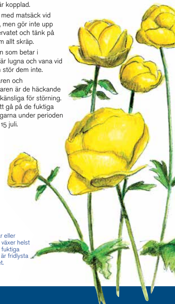
Smörboll eller daldockor växer helst på öppna, fuktiga ängar. De är fridlysta i hela länet.