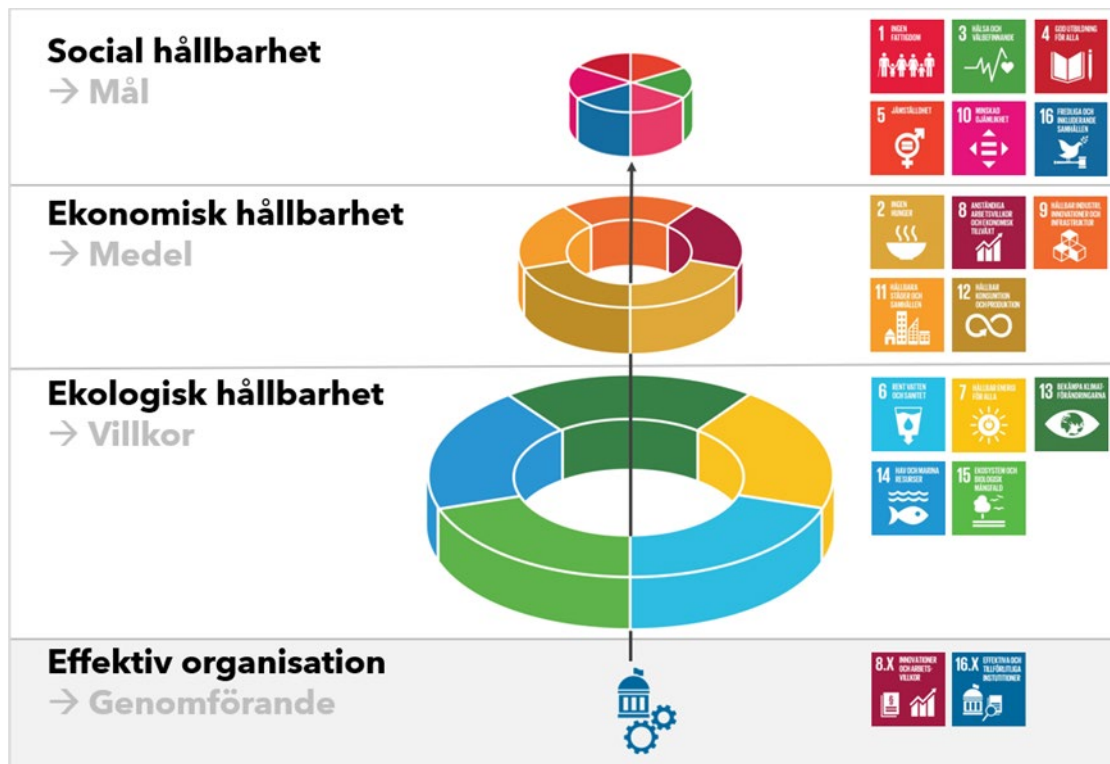
Figur 1: Nyköpings hållbarhetsarbete kan åskådliggöras genom en "måltårta". Den visar hur de globala målen fördelas mellan kommunens hållbarhetsprogram. De globala målen är odelbara och berörs olika mycket i respektive program. Målen fördelas utifrån vilket program som har störst bäring på respektive mål utifrån rådighet dvs kopplas till kommunens ansvars- och verksamhetsområden.