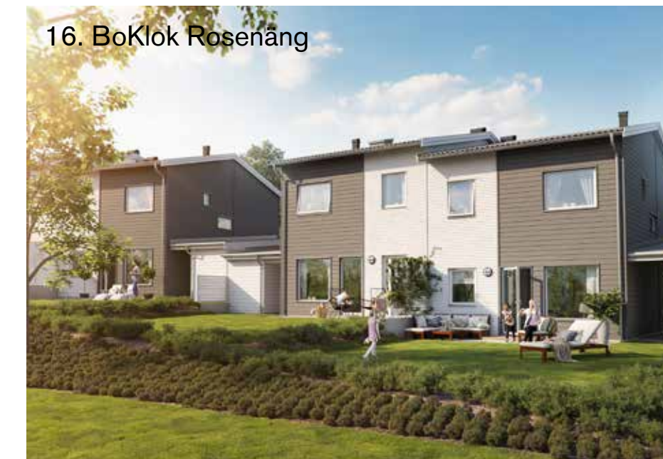
16. BoKlok Rosenfång