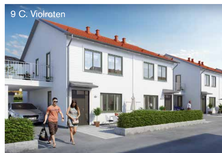
9 C. Violroten